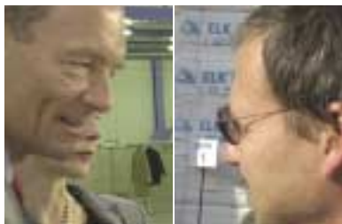
Interessierte Gäste erleben einen unterhaltsamen Abend in der Ziegler Papierfabrik

Zusammen mit Scitex durften wir uns an der diesjährigen Cebit in Hannover und an der IPEX in Birmingham präsentieren. So waren Rollen unseres Z-Plot 850 integraler Bestandteil bei der Vorführung einer Scitex Digital Printing Machine.